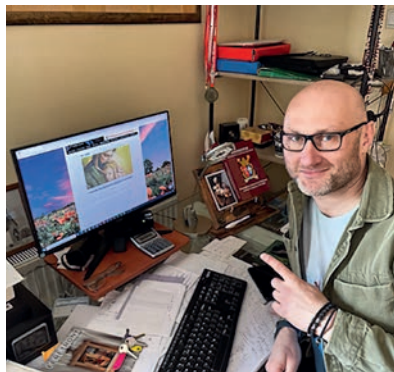
Po Wielkanocy przyszło natchnienie, żeby stworzyć Kącik św. Józefa